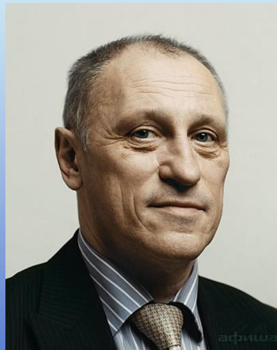
Декан экономического факультета МГУ профессор А.А.Аузан