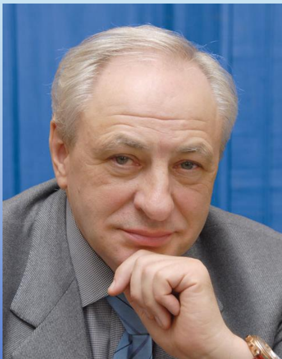
Декан биологического факультета МГУ академик М.П.Кирпичников